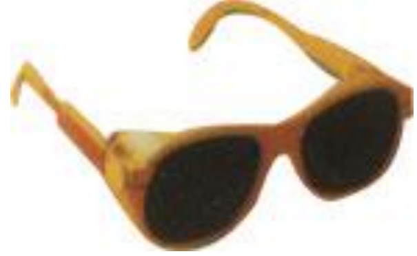
↑ ULTRA-VİYOLE, İNFRARED, KAYNAK GÖZLÜKLERİ