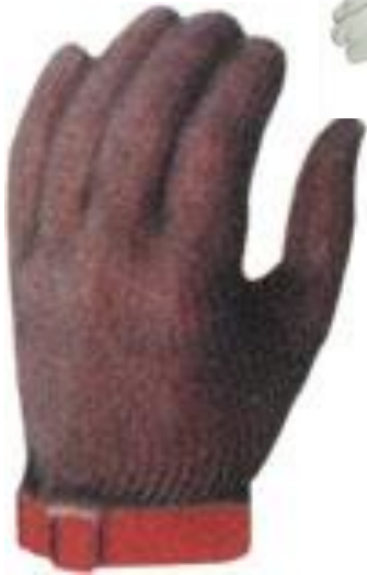
Metal Örgülü Eldiven