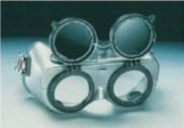
ÇOK AMAÇLI GÖZLÜK