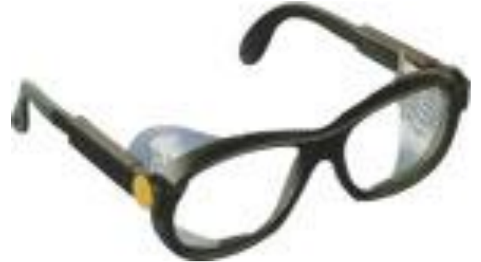
Yarı Kapalı Gözlük