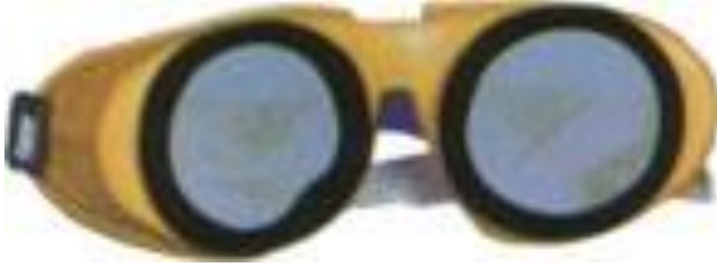
DARBEYE DAYANIKLI GÖZLÜK